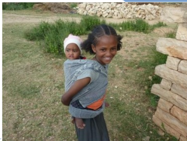
Niña huérfana "cabeza de familia", Wukro, Región de Tigray (Etiopía).

habilidades potenciar un endógeno, sostenible realizando intervención los derechos teniendo en equidad de