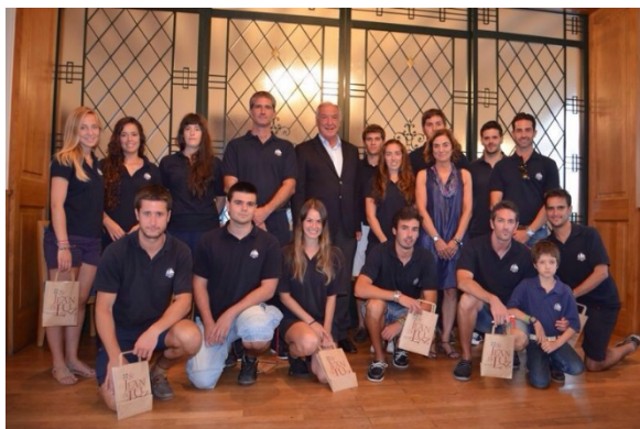
Recepción en el Ayuntamiento de San Juan de Luz