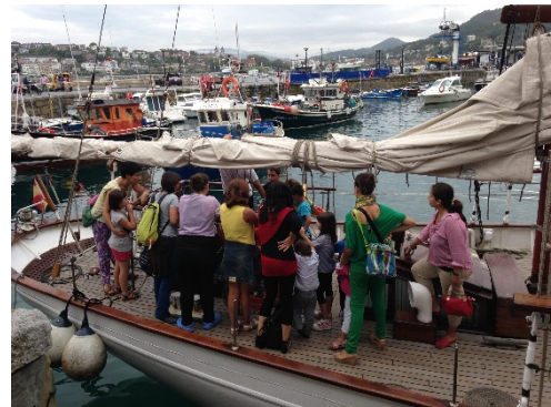
Puertas abiertas en Donostia