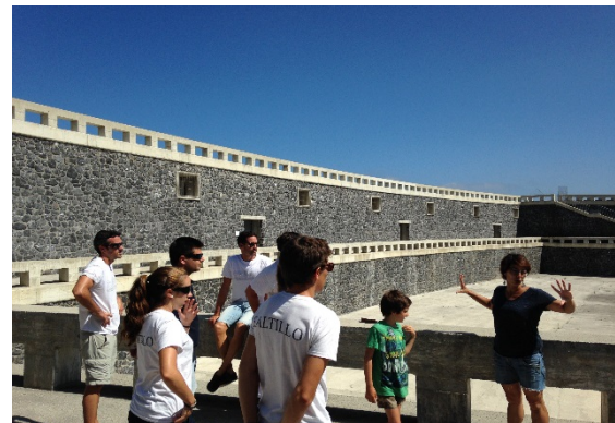
Visita al Centro de Acuicultura de Mutriku. Visita a la Central Mareo-motriz de Mutriku