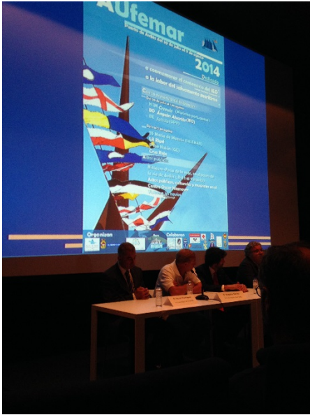
Presentación de las jornadas Aufemar