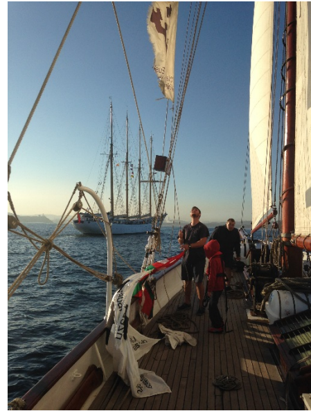
El b/e "Saltillo" junto al "Creoula"

5. Getaria: Continuando el viaje anterior, el 7 de agosto atracamos en Getaria para participar, a petición de las Autoridades Locales, en la Conmemoración del desembarco de Elcano representando la llegada al puerto de la Nao Victoria tras su periplo por el mundo.