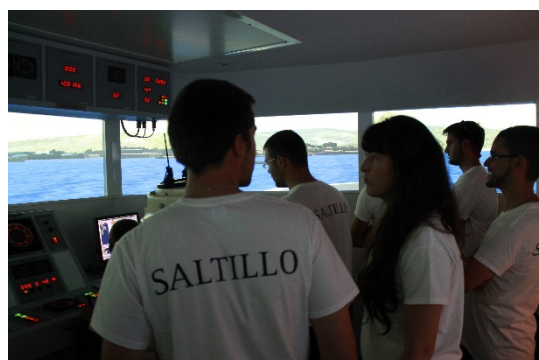
Visita a la Escuela Naval Militar de Marín.